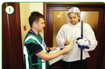
1 Уведомление спортсмена о необходимости сдать пробу