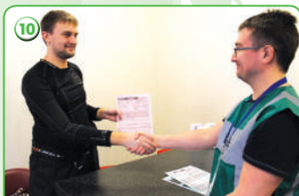
Окончание процедуры допинг-контроля