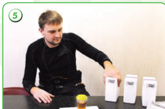
5 Выбор комплекта для хранения пробы