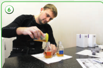
6 Разделение пробы по флаконам «А» и «В»