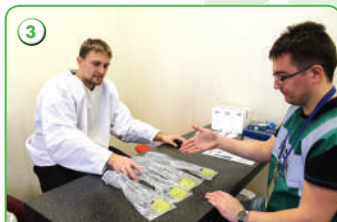
3 Выбор мочеприемника (емкости для сдачи пробы)