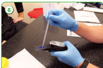
Проверка удельной плотности