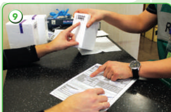
Заполнение протокола допинг-контроля и проверка внесенных данных